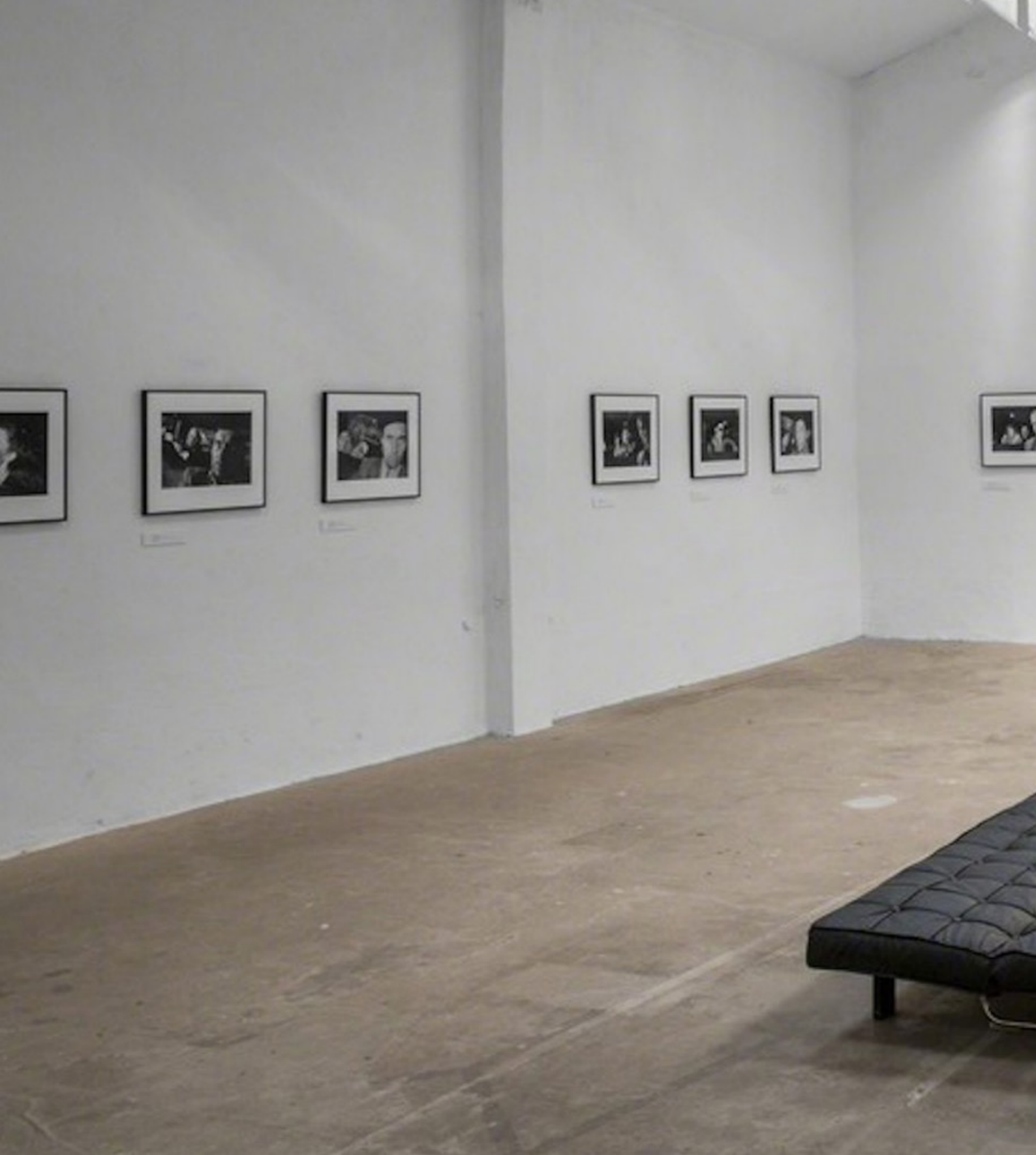
ESPRONCEDA Institute of Art & Culture Barcelona, Spagna.